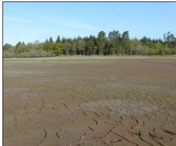
Étang du Pré mis en assec