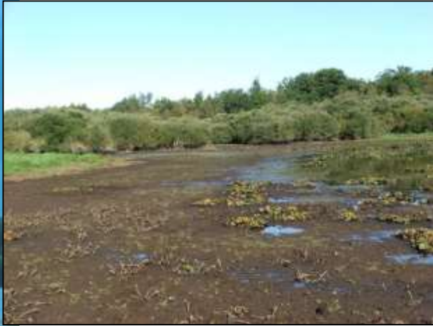
Marnage forcé d'un étang – exondation des rives