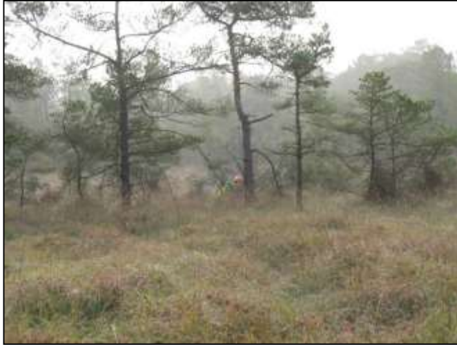
Abattage manuel des pins sylvestres