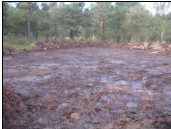
Après étrépage mécanisé