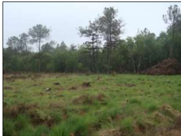
Après abattage et évacuation