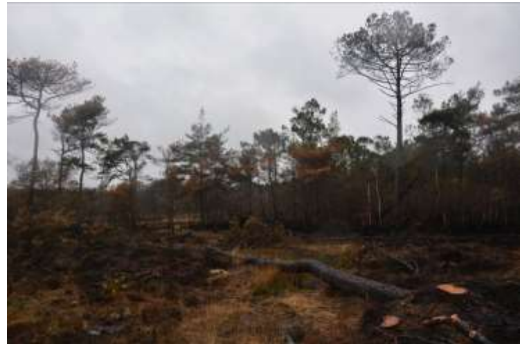
Vues du secteur le 30 mars 2016 après CG de l'Etang