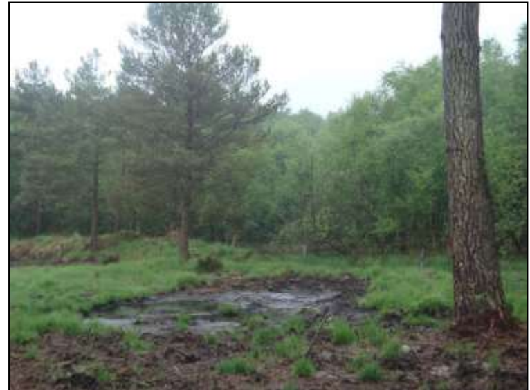
Dépression sur substrat tourbeux