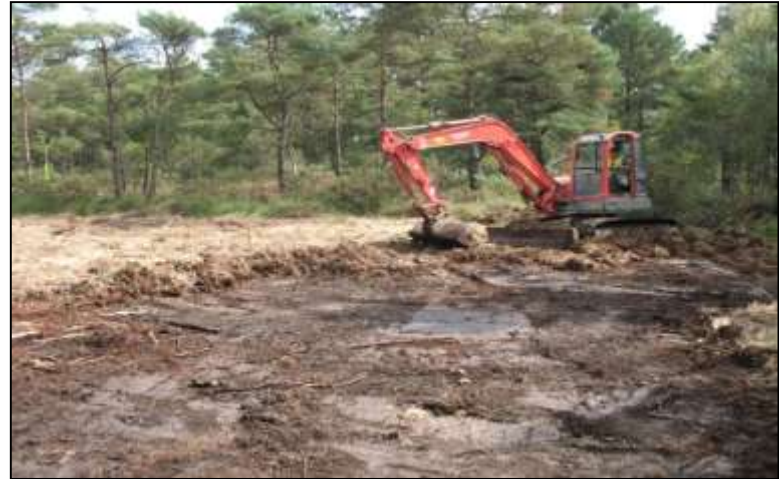
Etrépage à la pelle mécanique