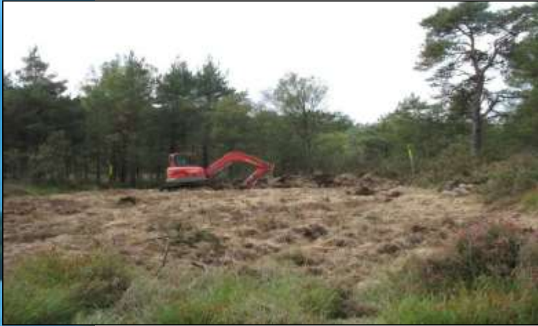
Avant intervention, fauchage manuel