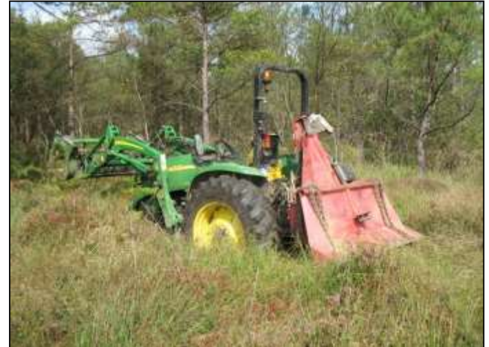
Treuil pour évacuer les bois