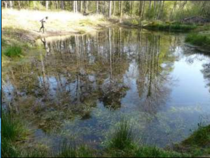
Mare forestière (2 ans après création)