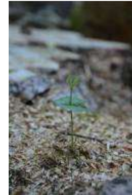
Vues de la parcelle éclaircie lors de l'hiver 2014-2015