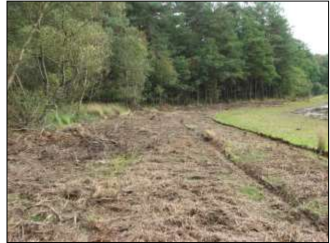
Broyage des végétaux de bordure (saules, pins, bouleaux)