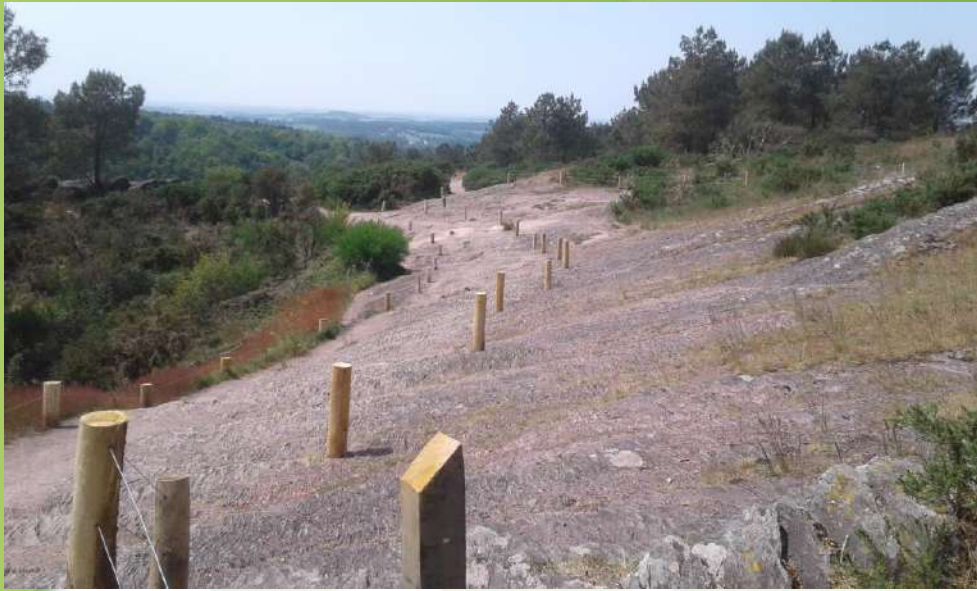
23 mai, le site est en fonction ; on a touché au but