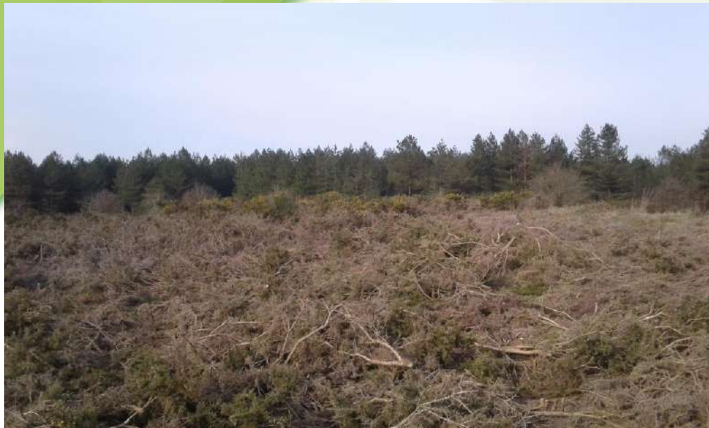
28 février, la lande est fauchée