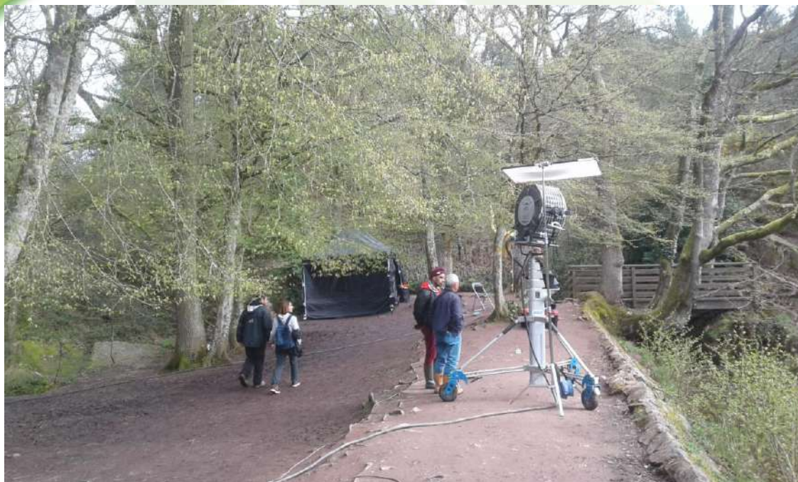
Silence, ça tourne le 12 avril 2018...pas d'évaluation ?