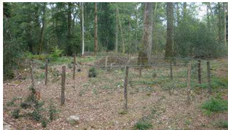
5 septembre 2012