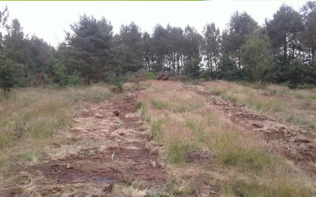
13 juin, lande exportée