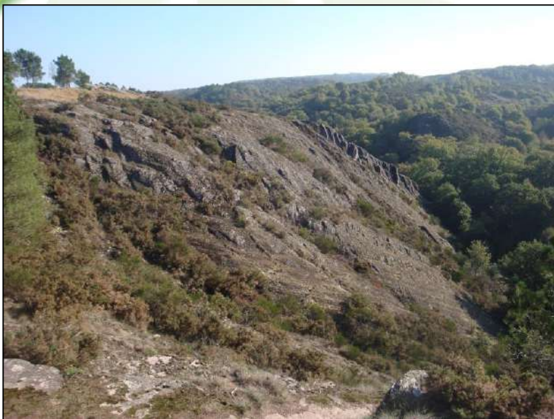
Etat sans piétinement