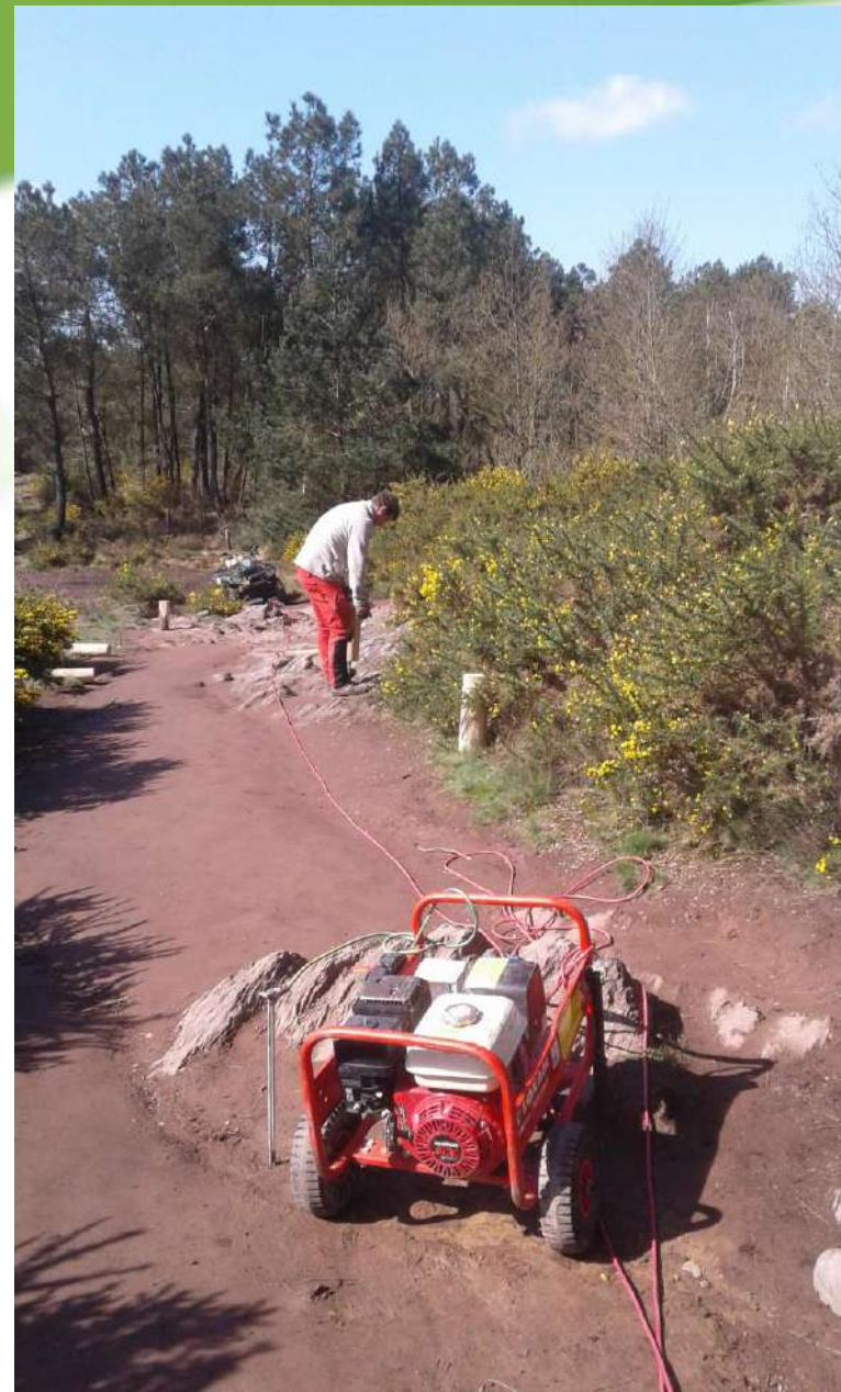
17 avril 2018, le groupe électrogène portatif