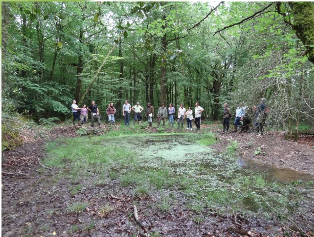
Devant la mare créée en octobre 2015