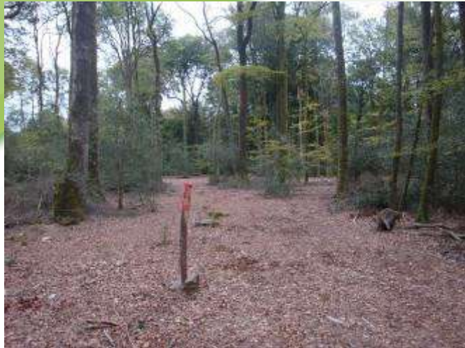
5 octobre 2011