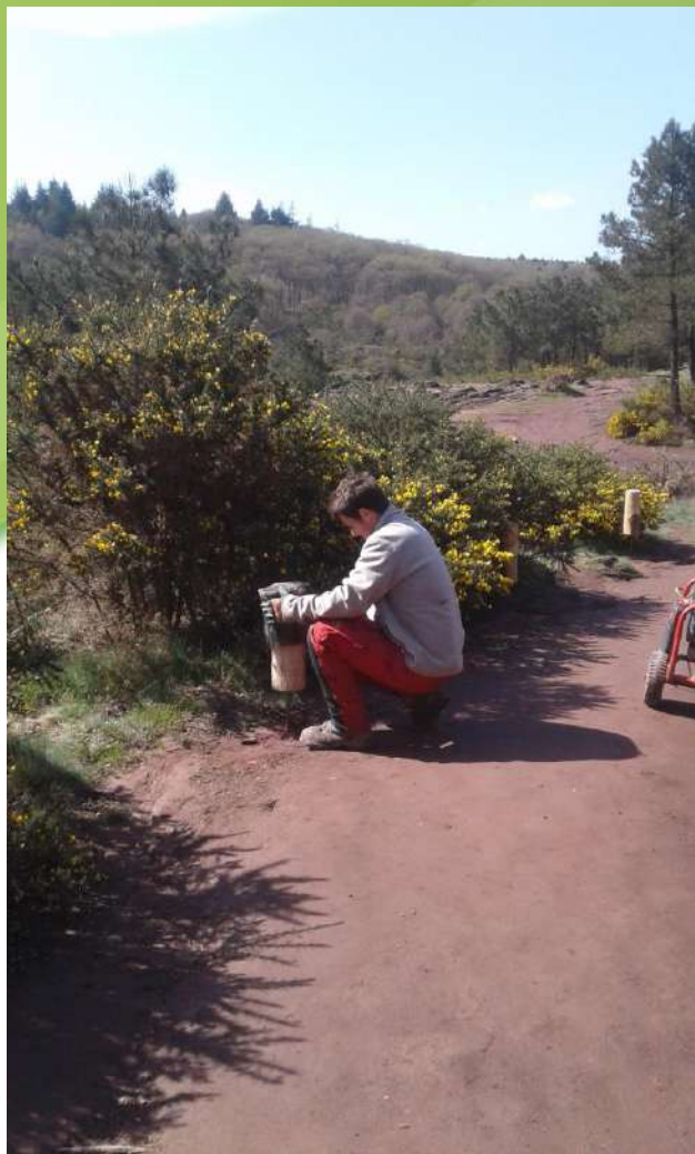
17 avril, l'ouvrier de chez Dervenn qui enfonce les plots en châtaignier avec une cloche