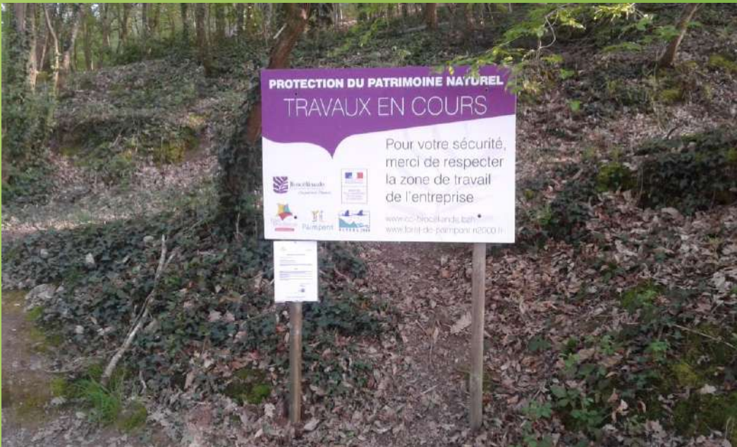
12 avril, piquetage du tracé avec l'entreprise Dervenn ; 16 avril début des travaux