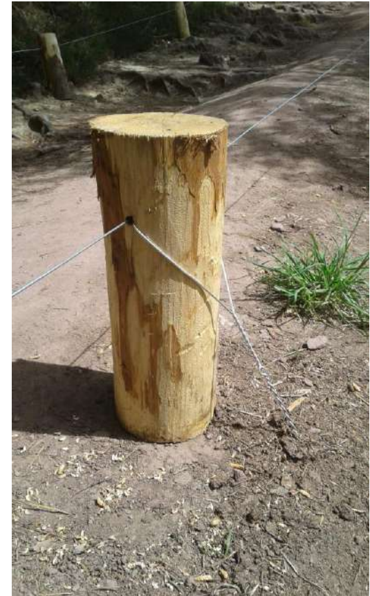
26 avril, les finitions pour l'arrivée de la presse