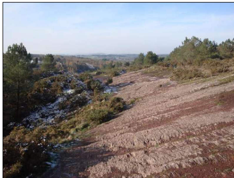
Etat avec piétinement