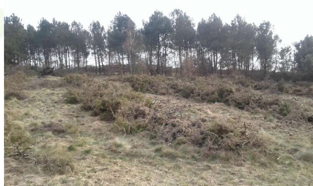
28 février 2018