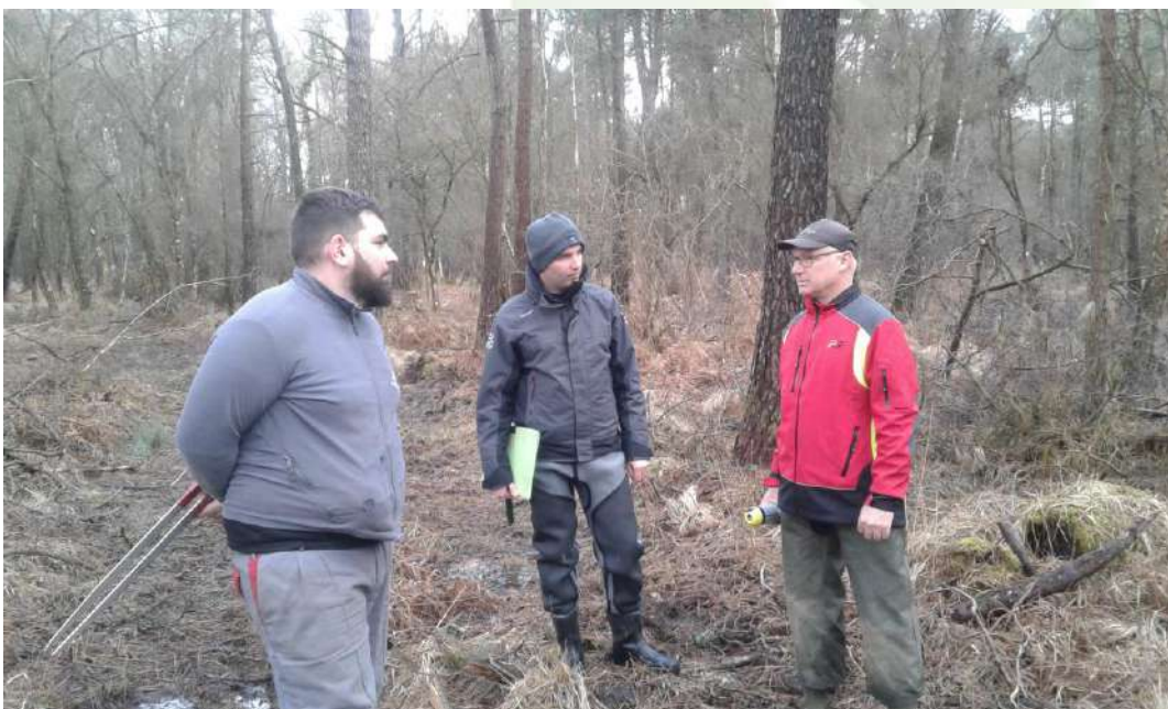
15 mars 2018, c'est parti pour le martelage