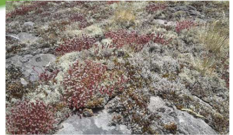
23 mai 2018, pelouse pionnière sur dôme rocheux