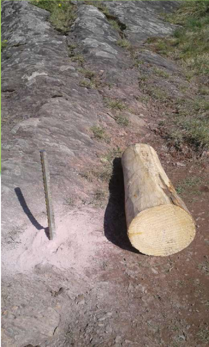
17 avril, les fers à béton commencent à être installés