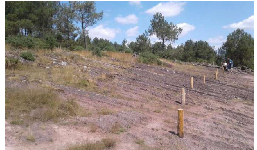
9 juillet, la végétation reprend ses droits