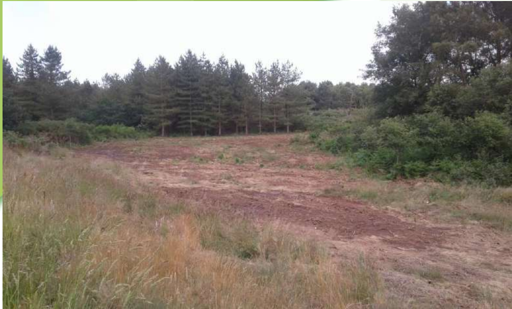
13 juin 2018, lande exportée