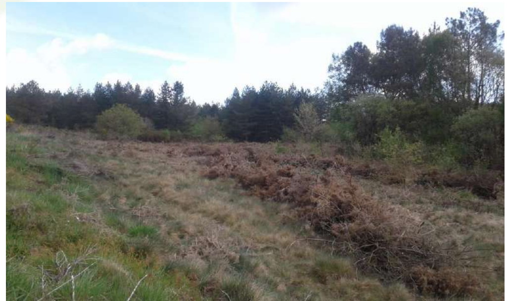
26 avril 2018, la lande est partiellement andainée

Avant les travaux : des ajoncs omni présents et très inflammables