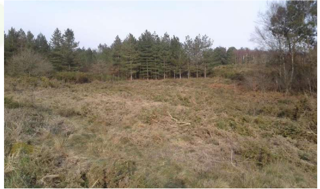
28 février, lande fauchée

Après les travaux : débusquage « en plein »