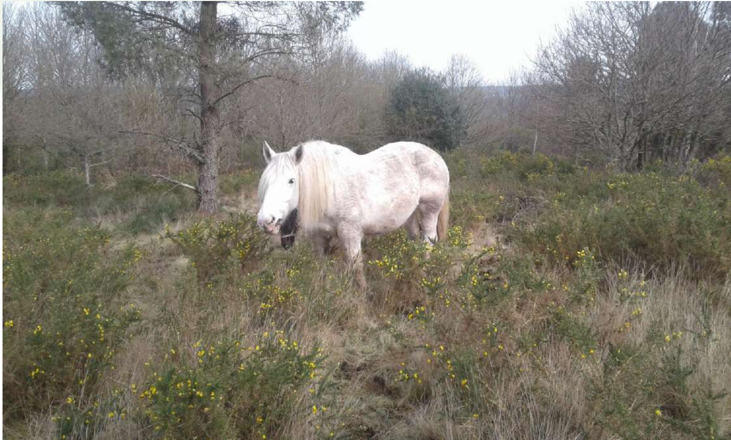
12 avril 2018, visiblement l'ajonc est à sa convenance

Les percherons aussi sont sur la lande au dessus du miroir aux fées mais ils ont certainement été mis un peu trop tôt dans la parcelle