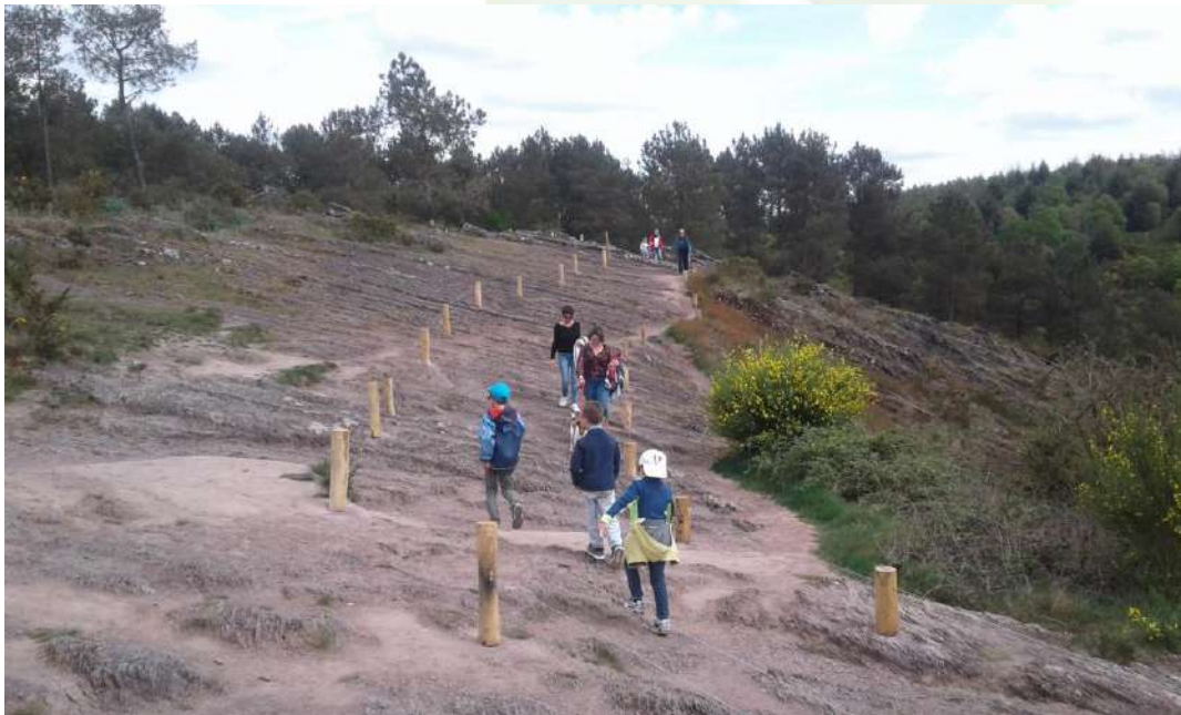
27 avril, les travaux sont quasiment terminés