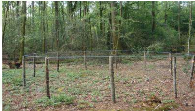
18 juin 2012