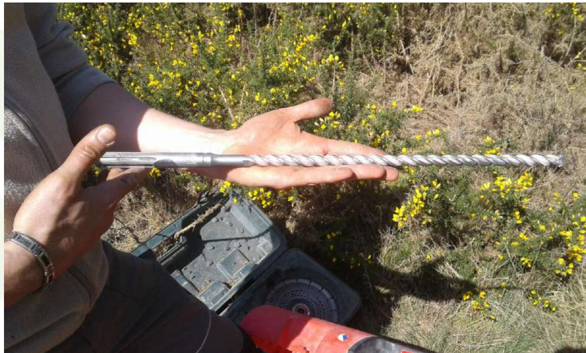
Le forêt pour percer le schiste